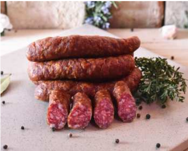
Imster Hauswürstel mild 1kg €21