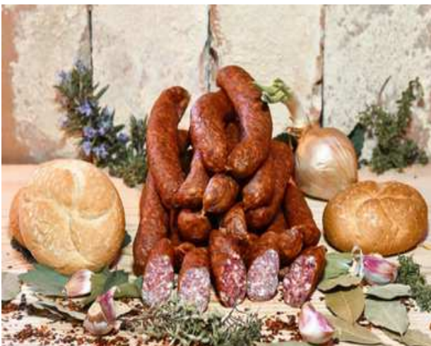
Hirschboxerl 135g/1kg €6/€30