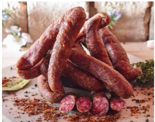
Imster Hauswürstel scharf 1kg €21