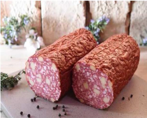
Käswurst doppelt ger. 1200g €26