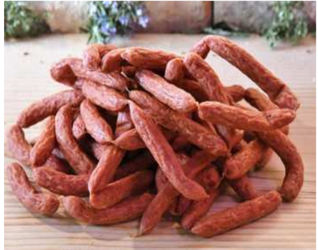
Wiener Würstel 250g/1kg €7/€21